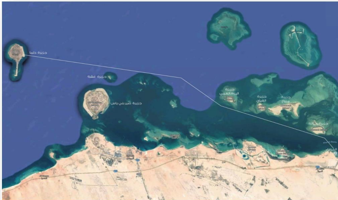
مسار خط سير السباق حسب الشكل